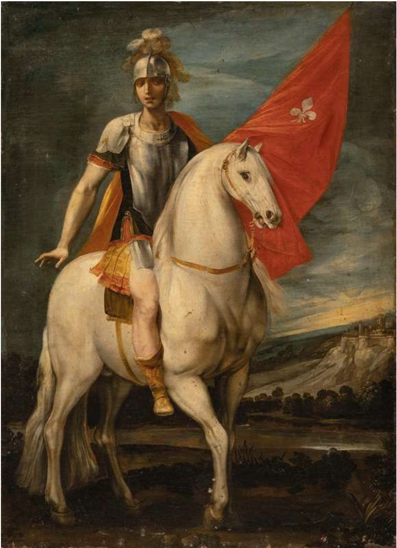
Saint Louis of Toulouse on horseback