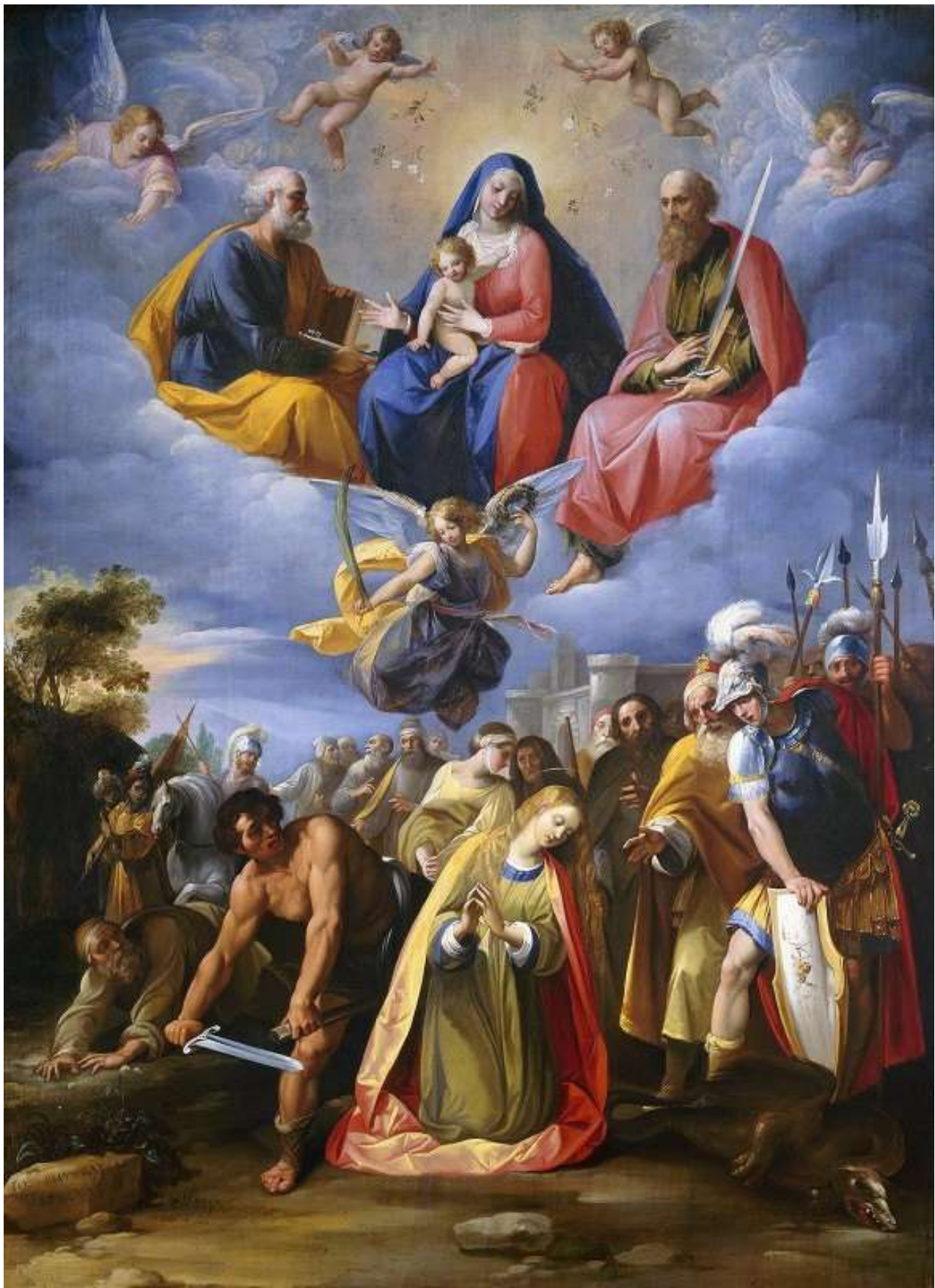
Martyrdom of Saint Margaret (1608-1611)