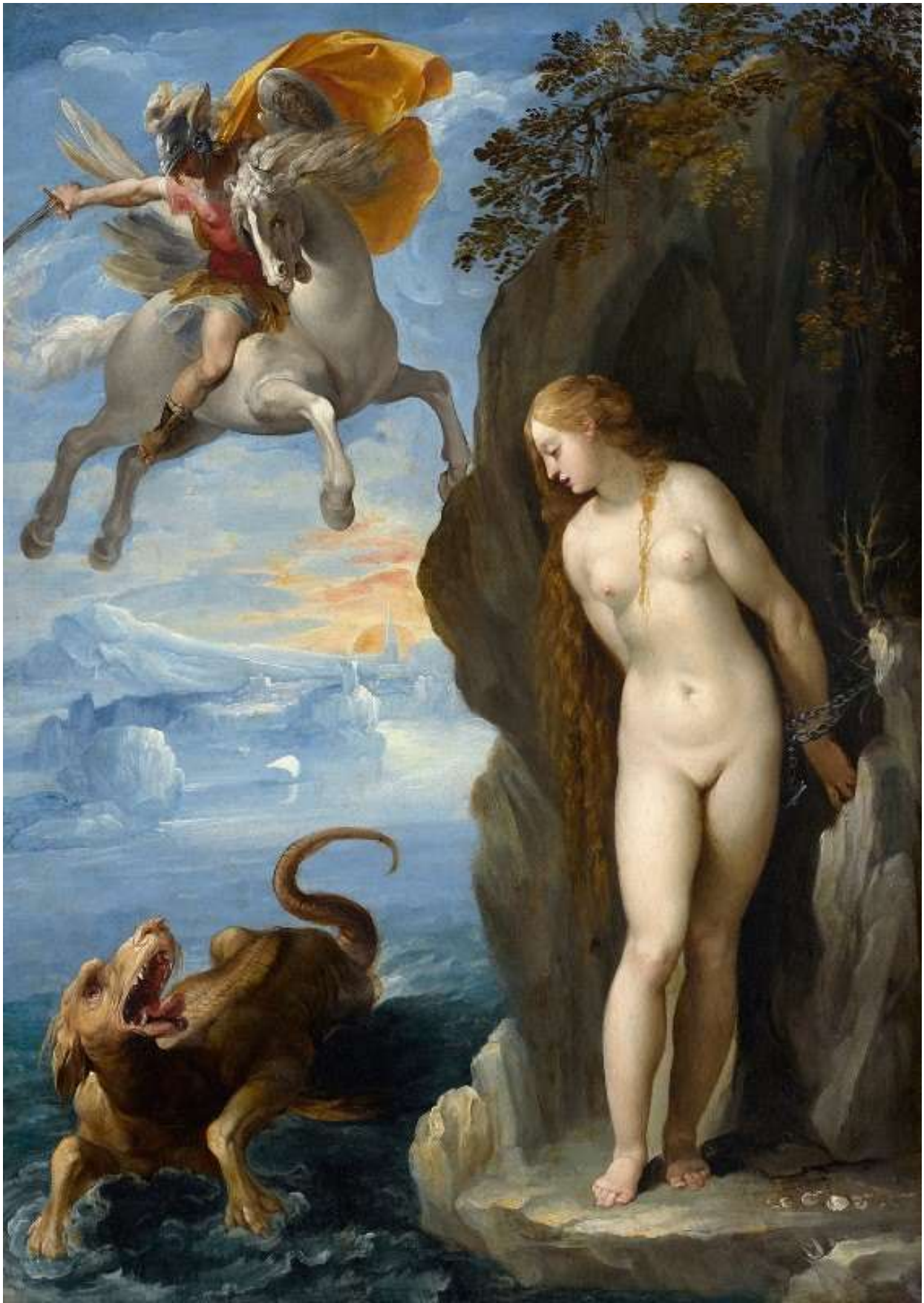
Perseus Rescuing Andromeda (1594)