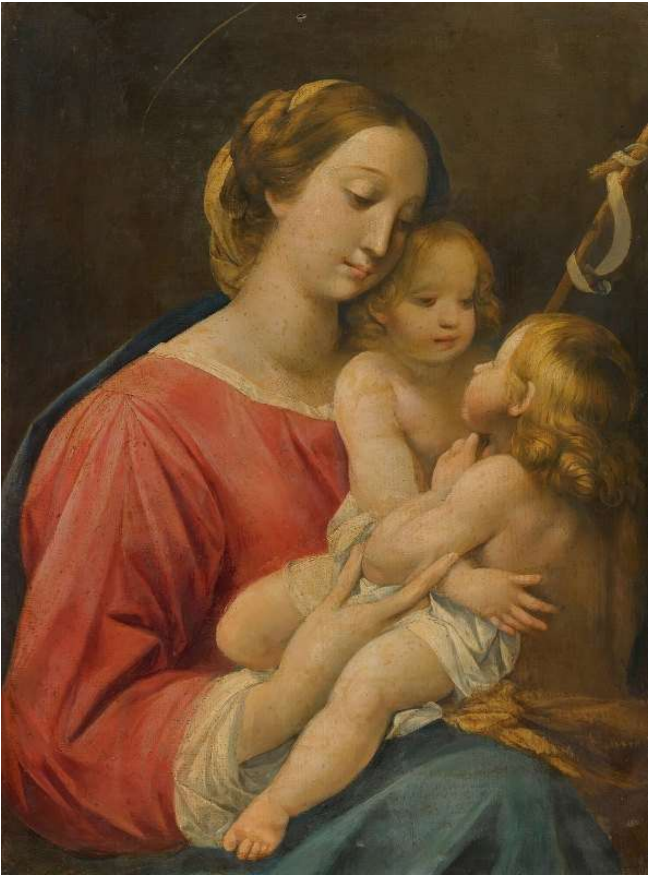
The Madonna And Child With The Infant Saint John The Baptist