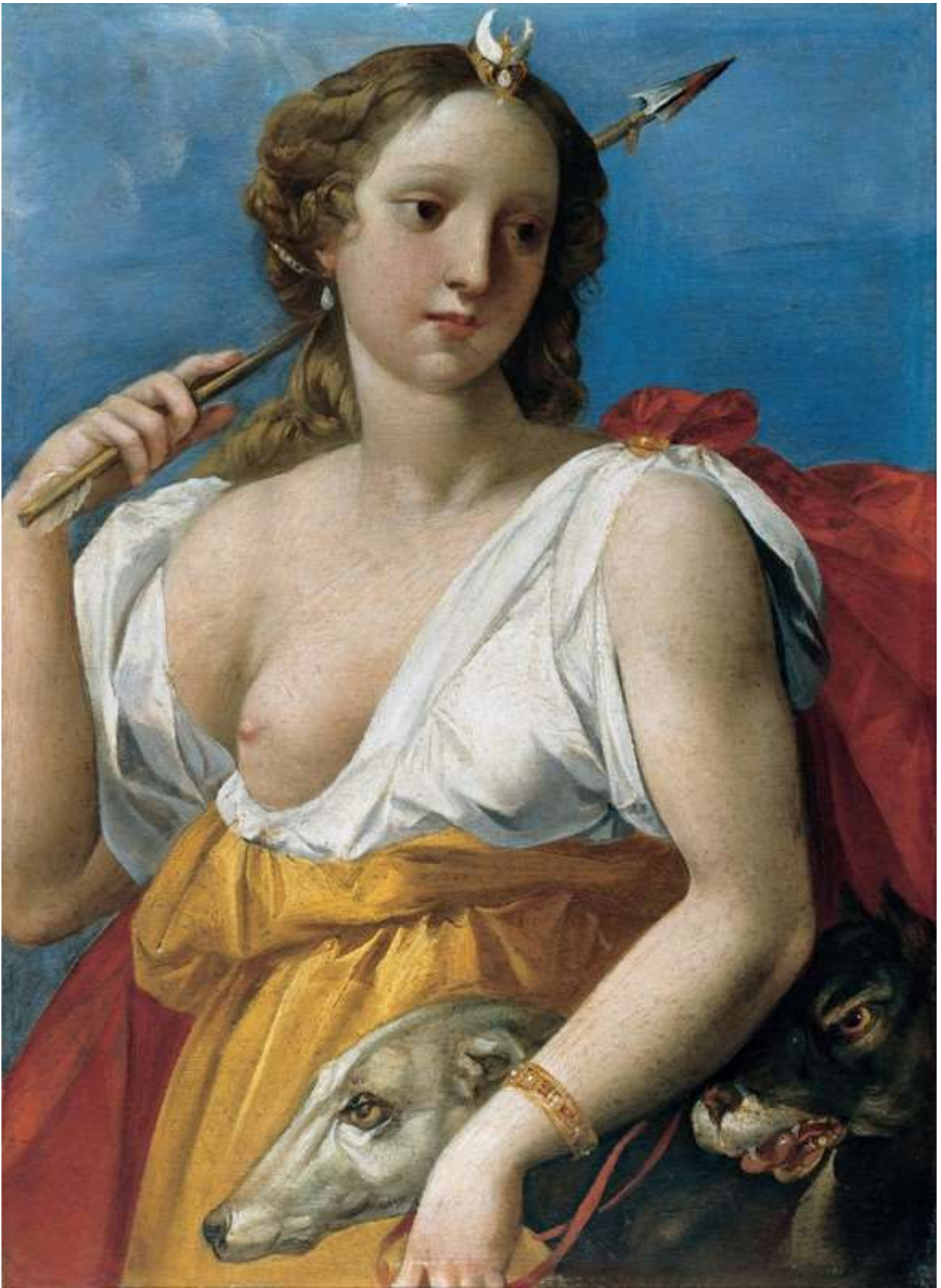
Diane the Huntress (1601 - 1603)