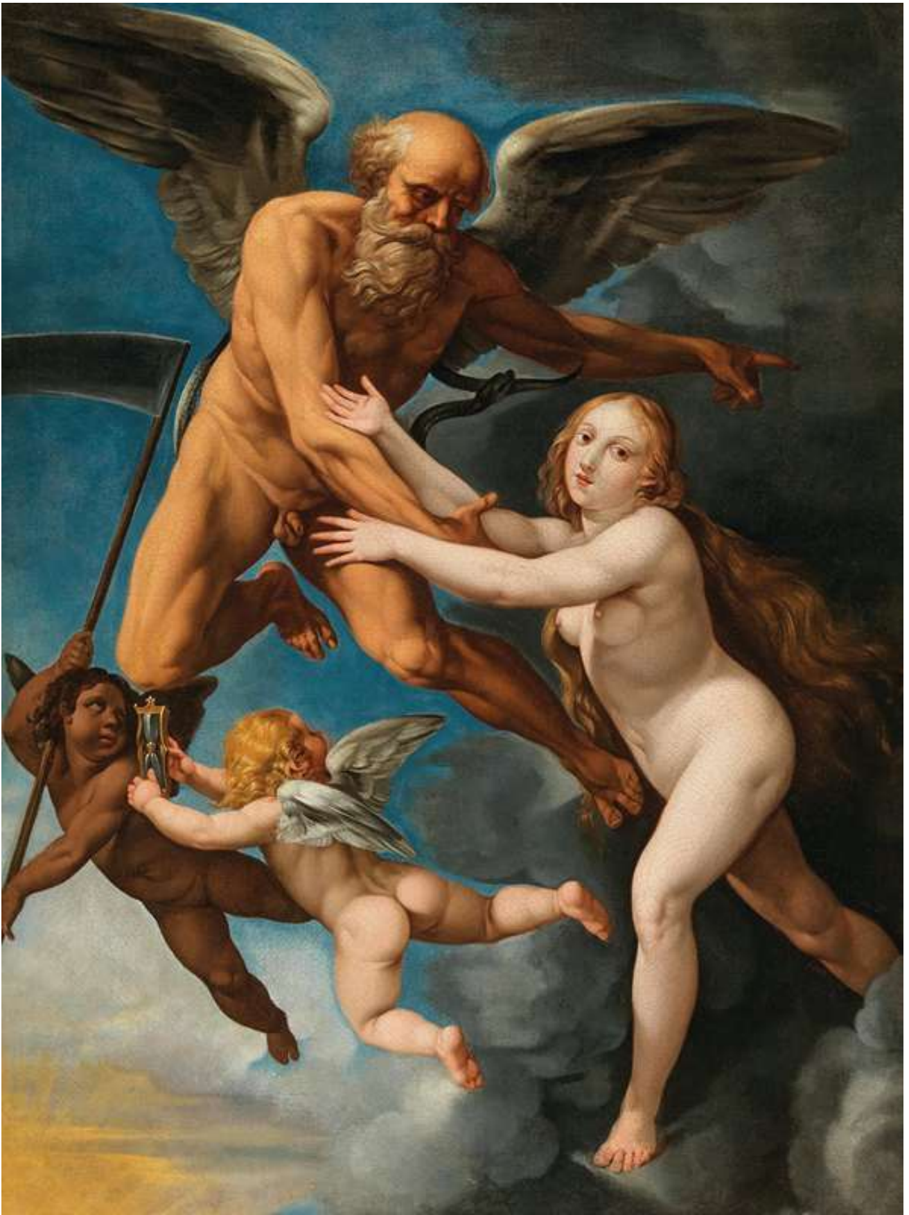
Time abducting truth