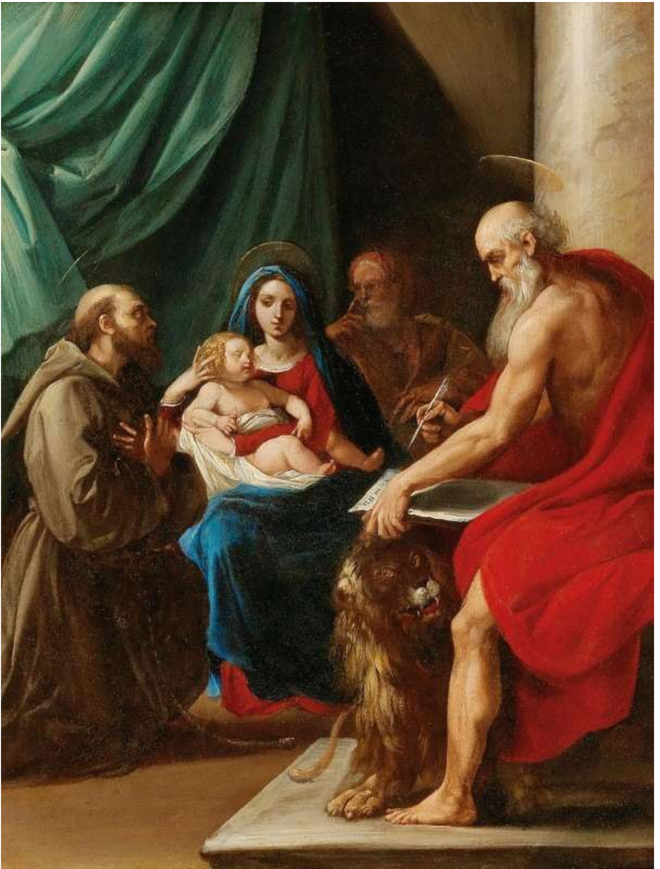
The Holy Family with Saint Francis and Saint Jerome