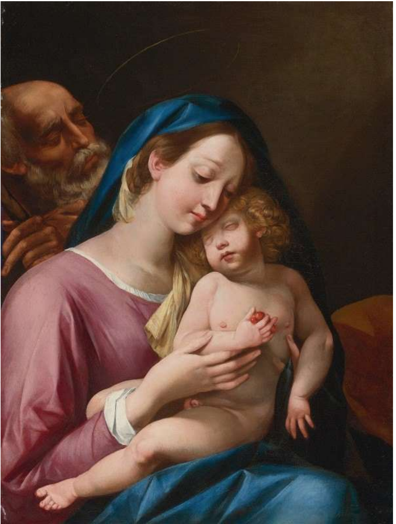
The Holy Family