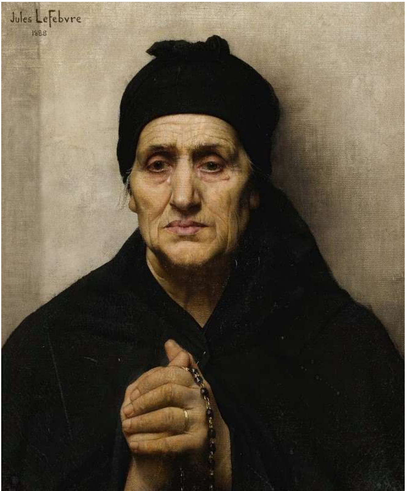
An Elderly Greek Woman (1888)