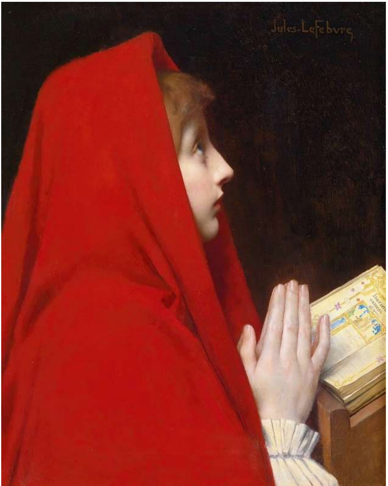
The Red Cloak