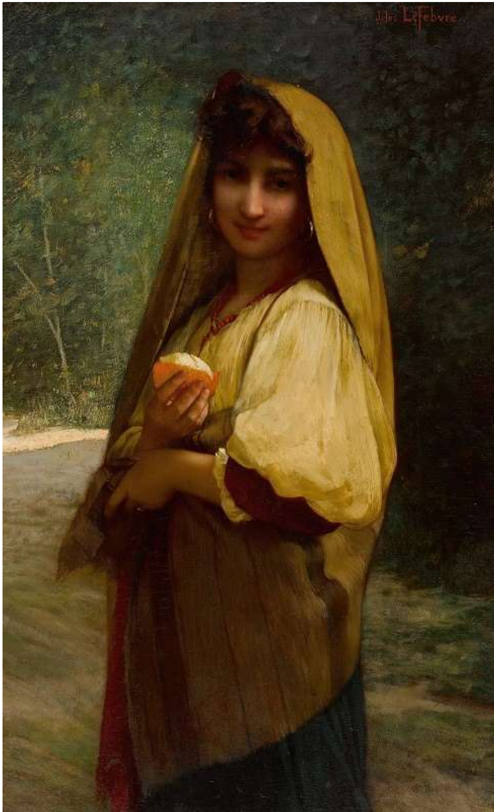
An Italian Girl With An Orange