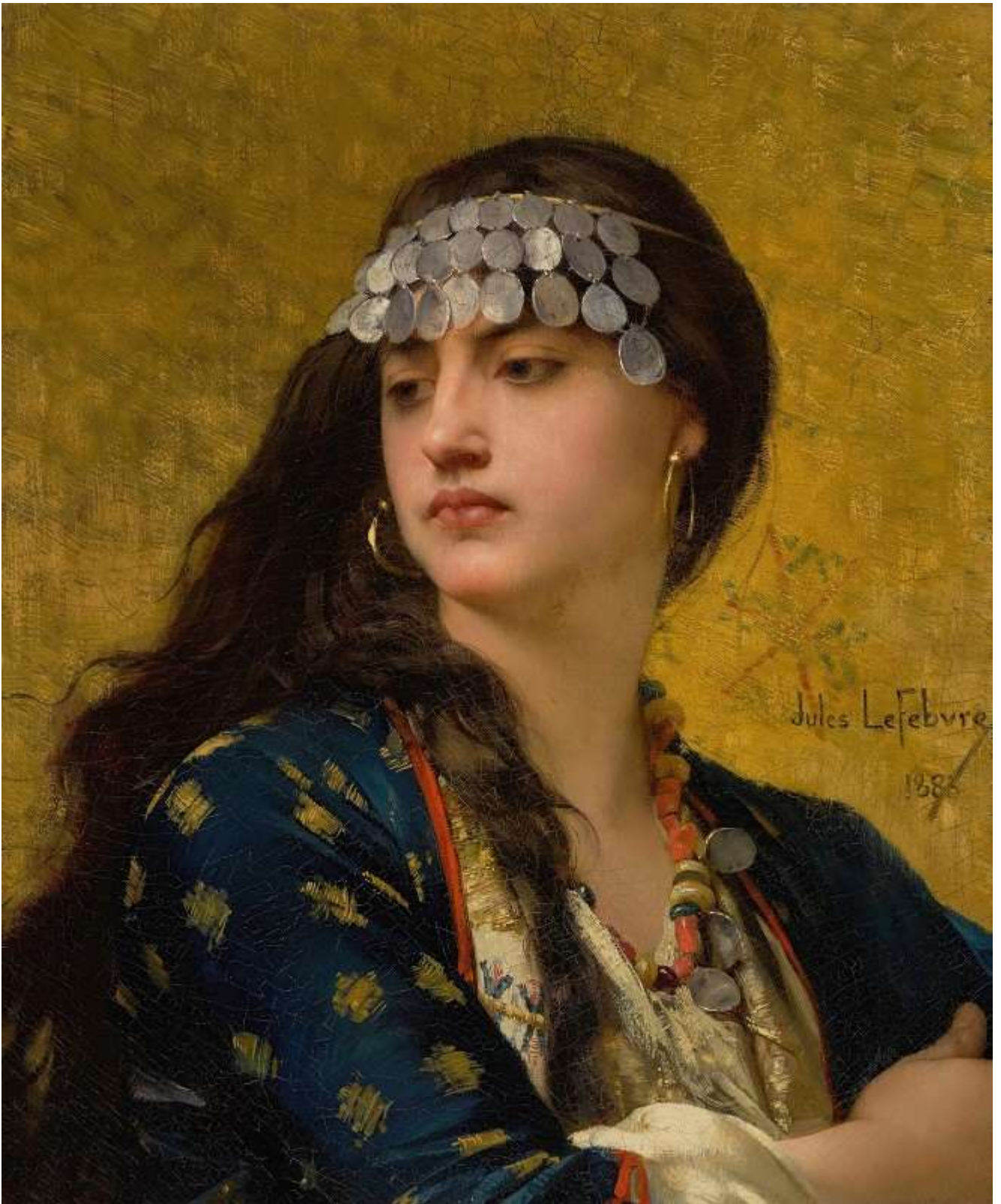
Fatima ( 1883)