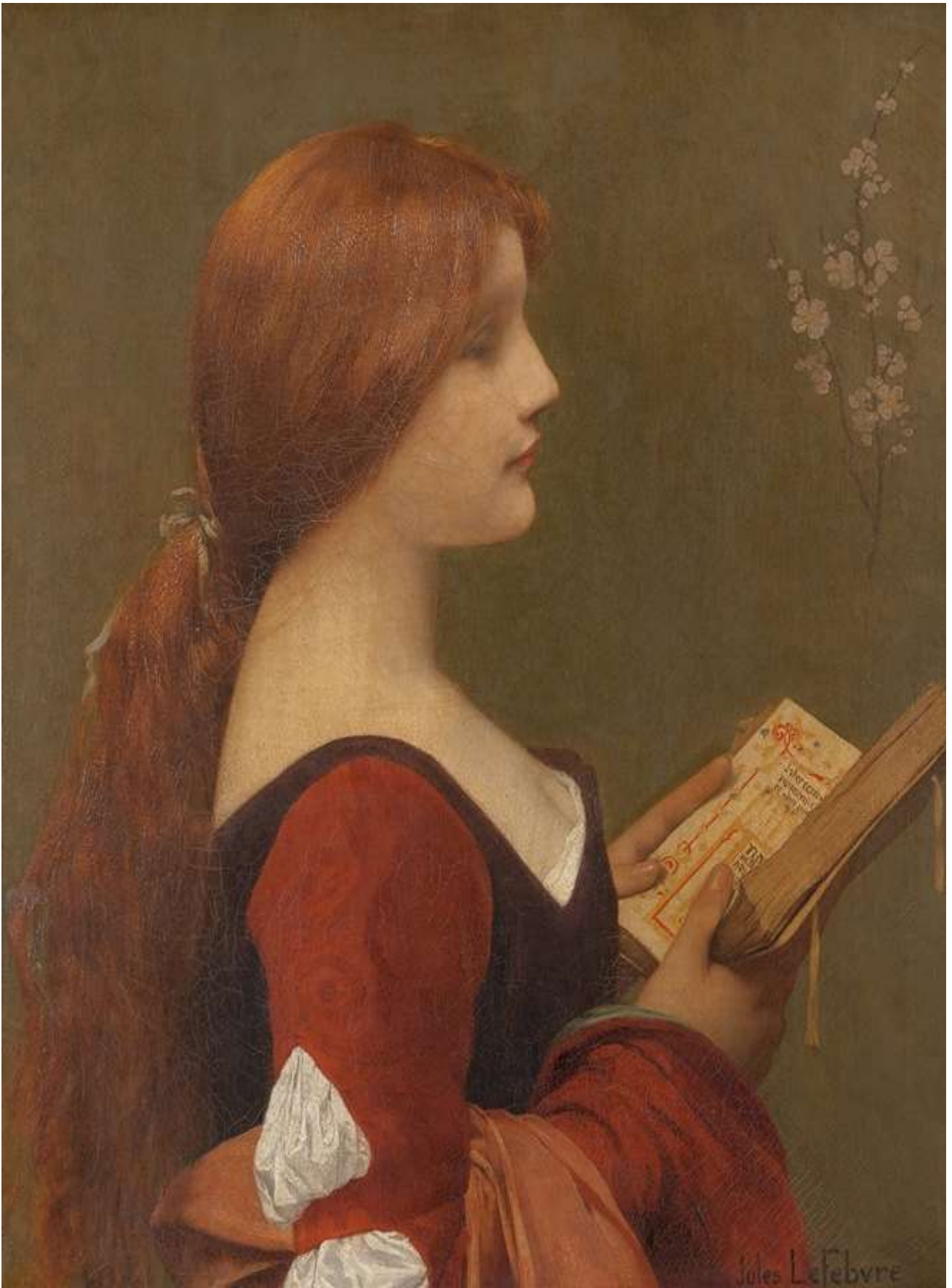
Jeanne la Rousse