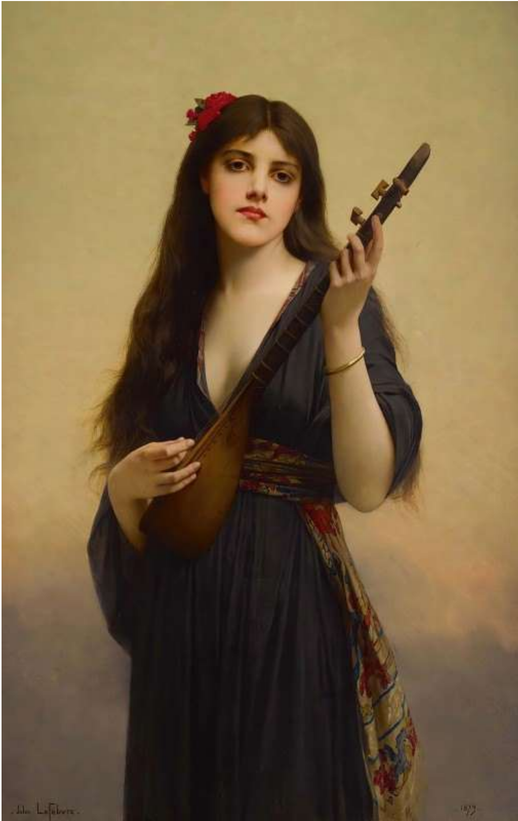
Woman Playing A Lute (1879)