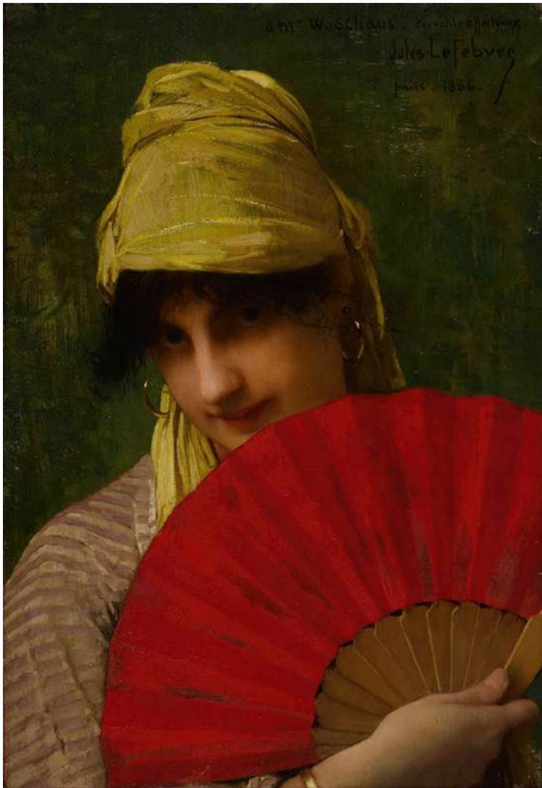
The Red Fan (1886)