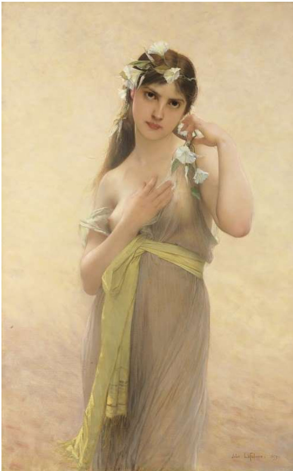
Morning Glory (1879)