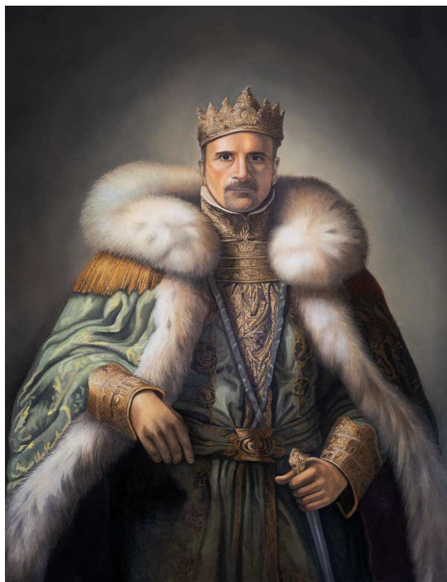
L. Vouliot, Portrait Royal Dominique , huile sur panneau bois, 50 x 65 cm, 2025