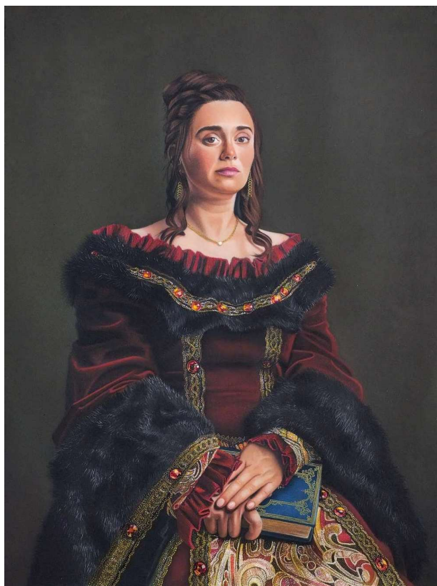
L. Vouliot, Portrait Royal Marie , crayons pastel et stylos, 50 x 65 cm, 2022

Email : laurene.vouliot@gmail.com Instagram : @laurenevouliot