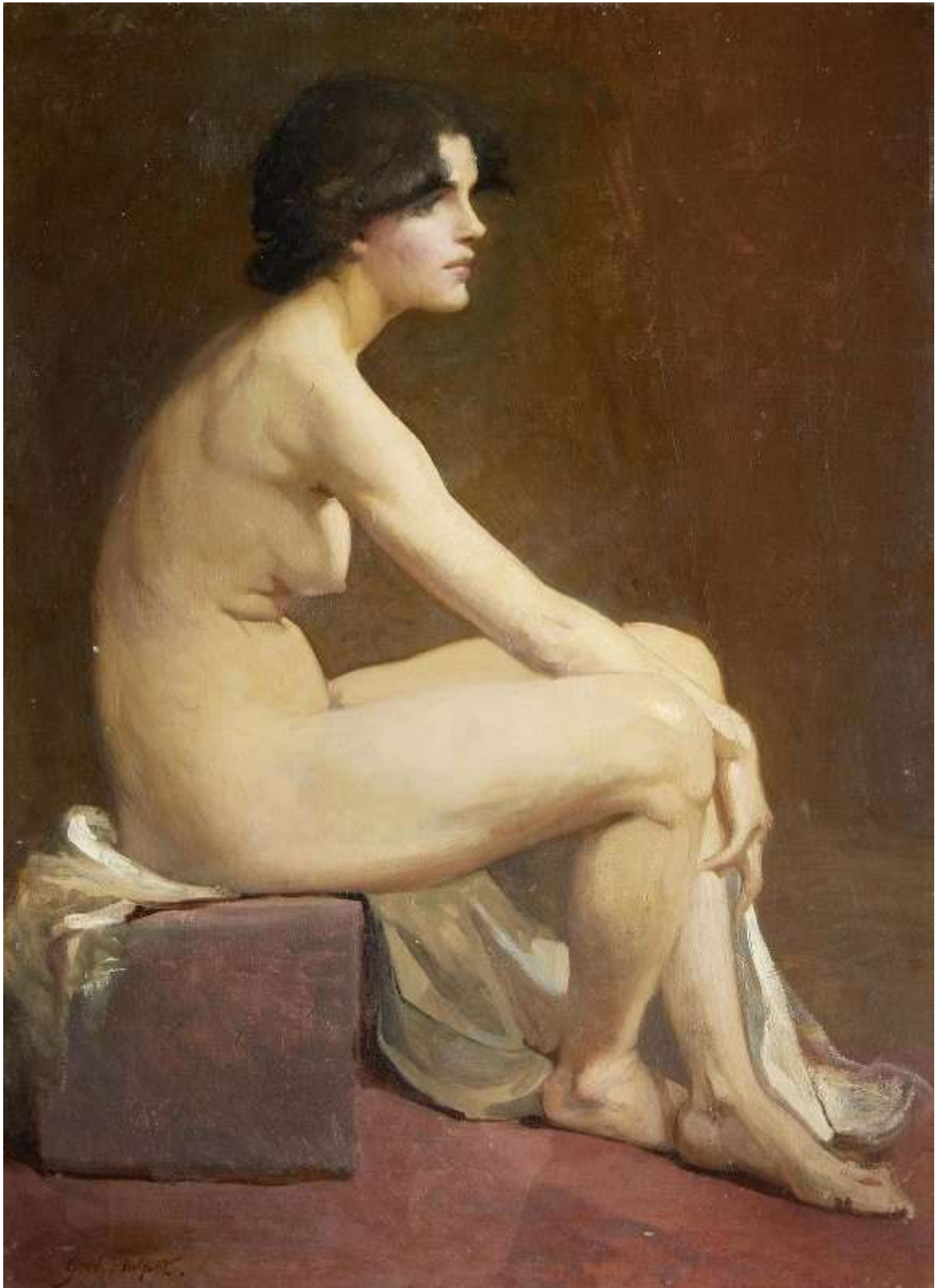
Portrait of a Female Nude