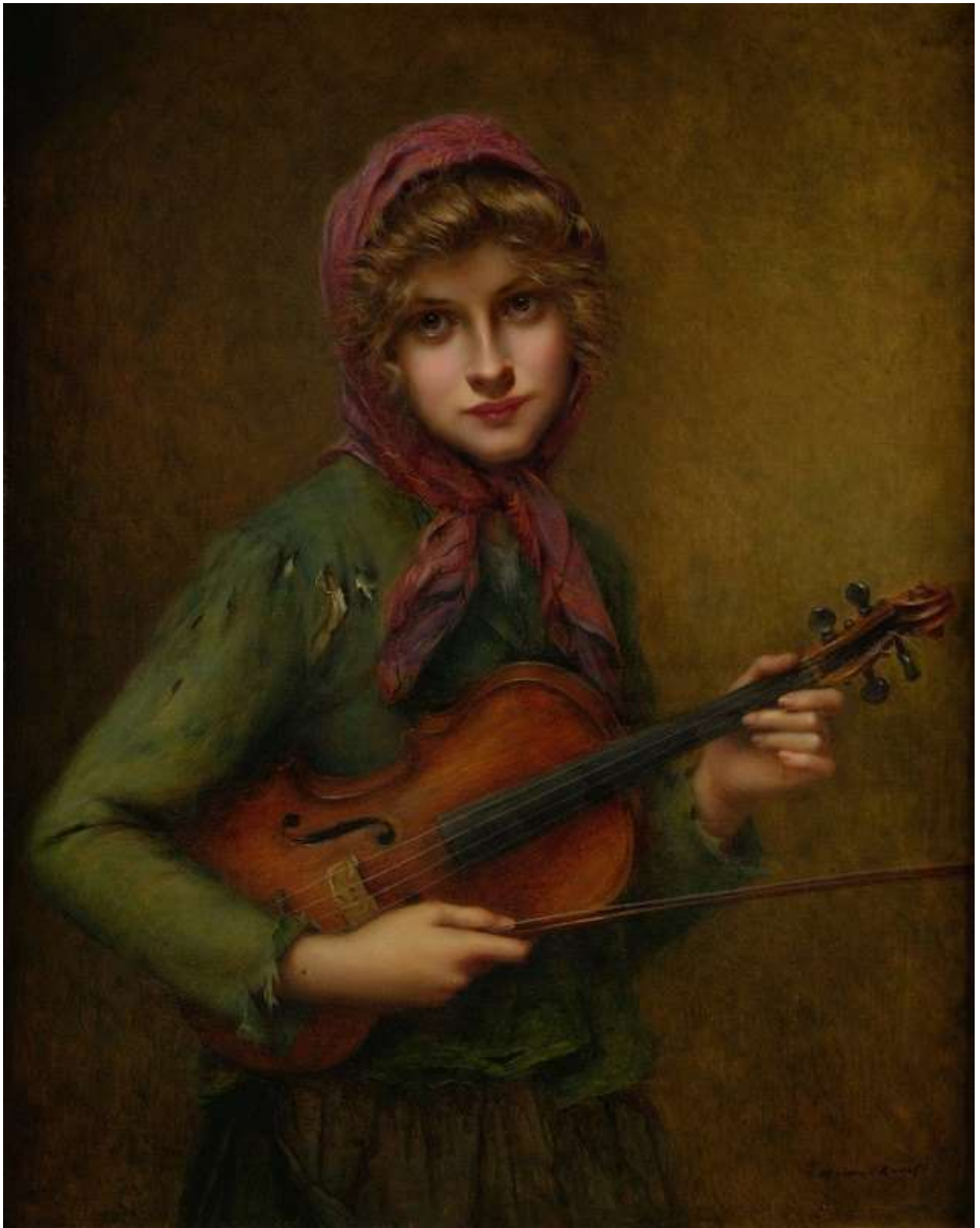
The Young Violinist