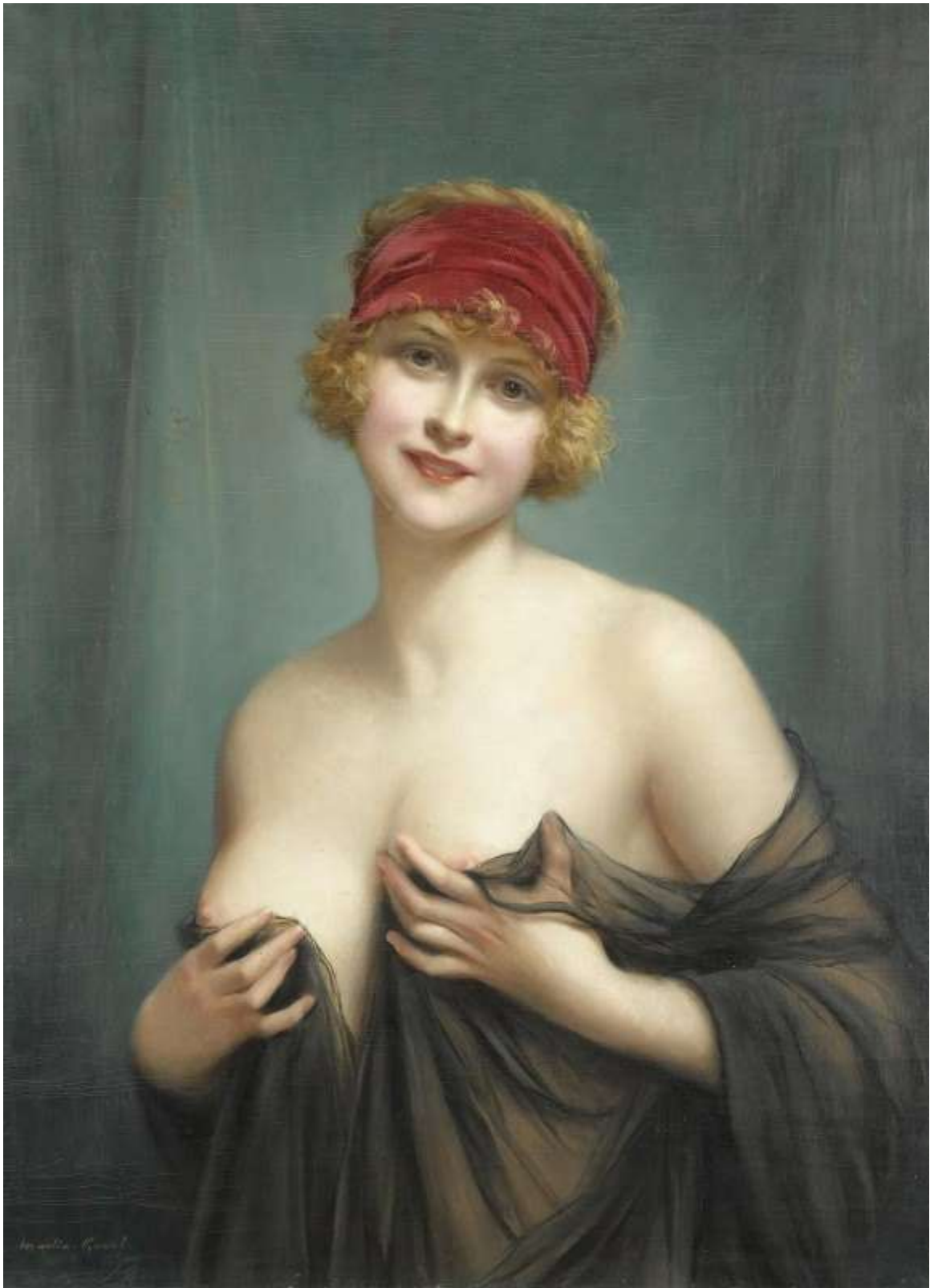
Jeune Femme En Deshabille