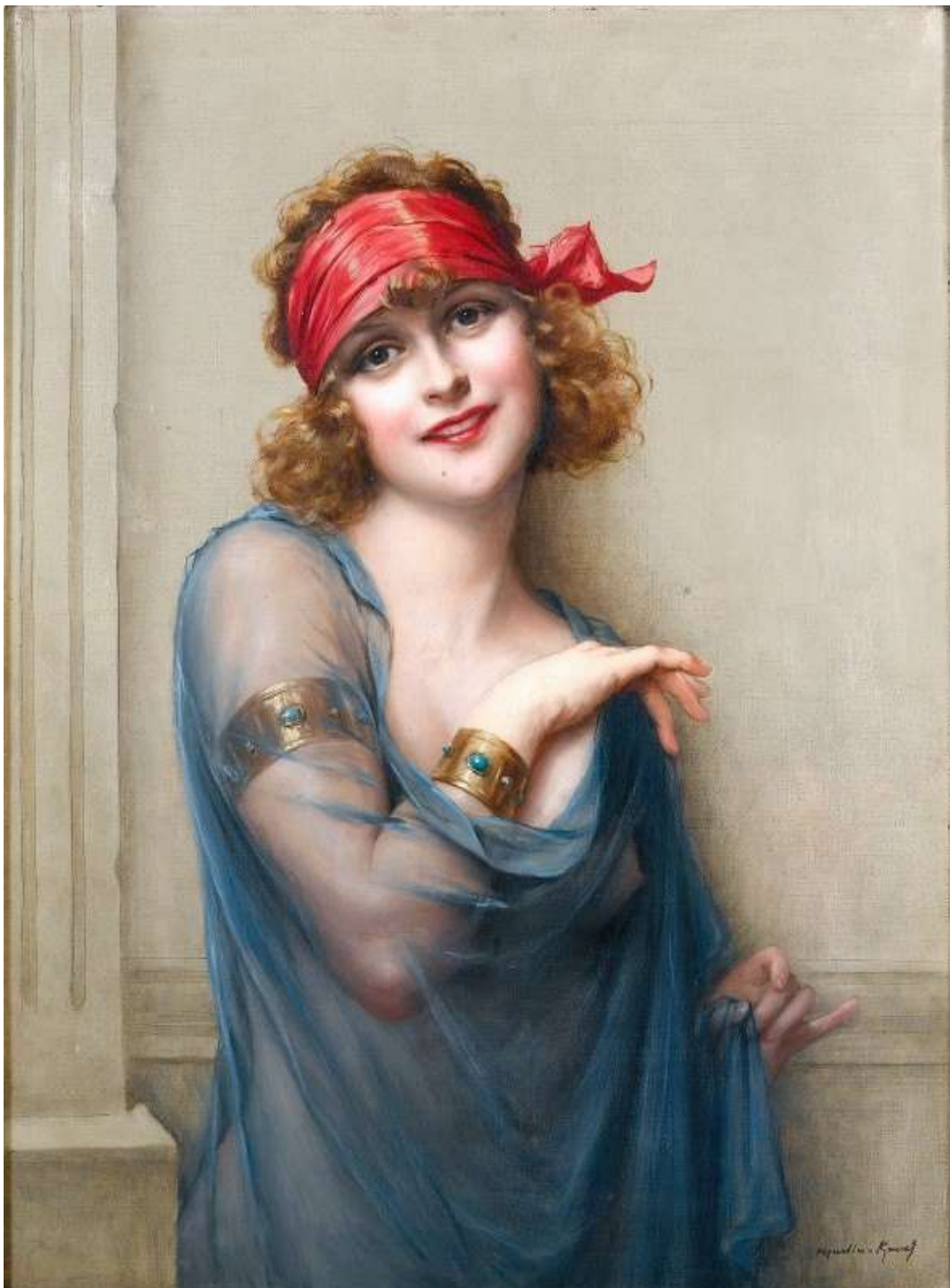
Le voile bleu

En plus de ses portraits populaires, il était également connu pour ses natures mortes et ses paysages. Né le 25 mai 1846, Martin-Kavel expose régulièrement au Salon des Artistes Français. En tant que membre du salon, il a reçu une médaille pour son travail en 1881. L'artiste est décédé en 1909.