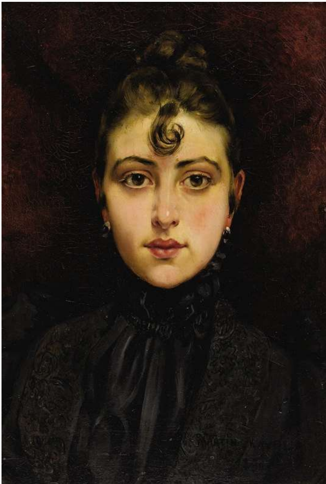
Portrait de jeune femme (1890)