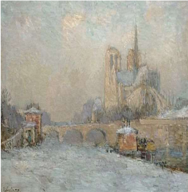
Vue de Notre-Dame de Paris - Albert Lebourg (1849 - 1928)