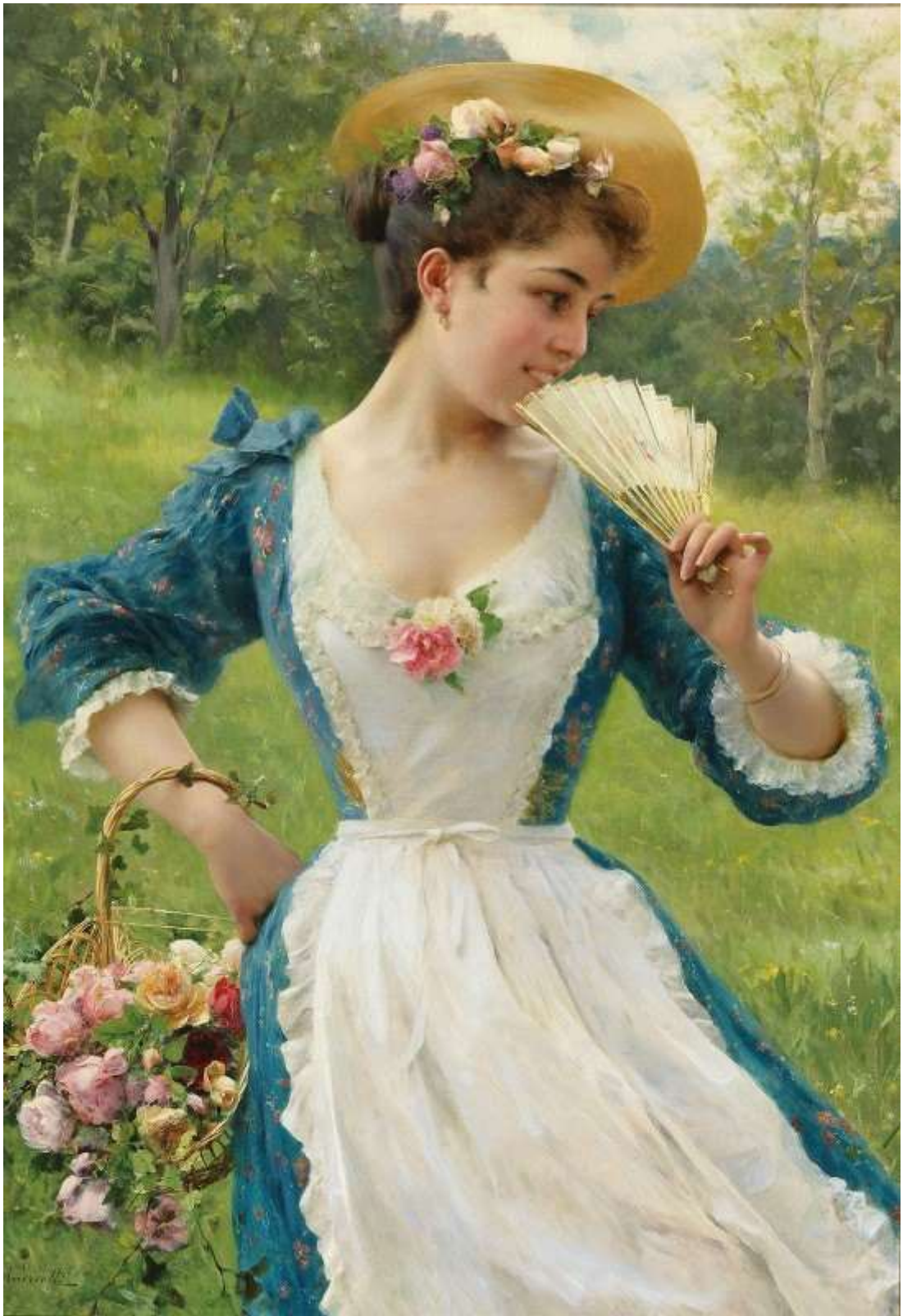
Young Beauty With A Basket Of Roses