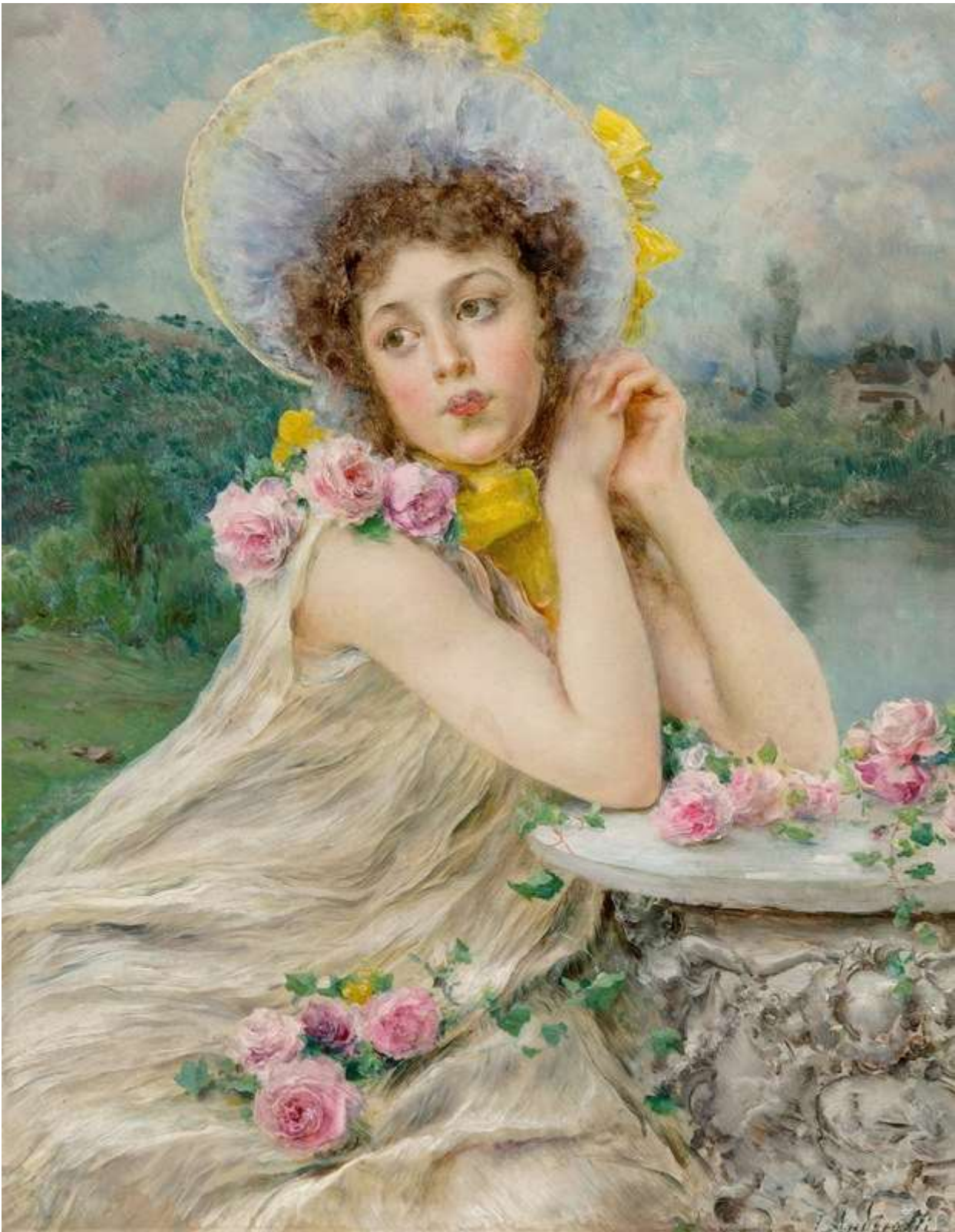
Lost in thought