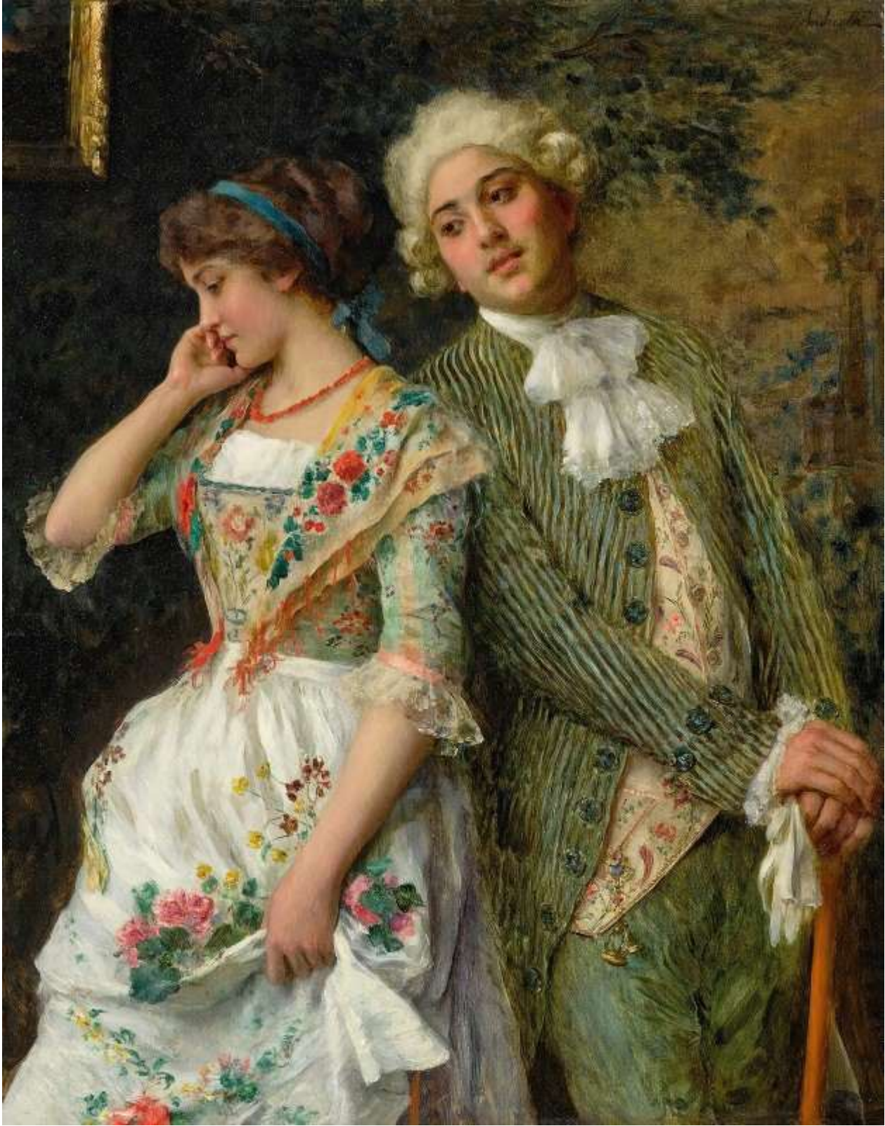
A Bashful Maiden