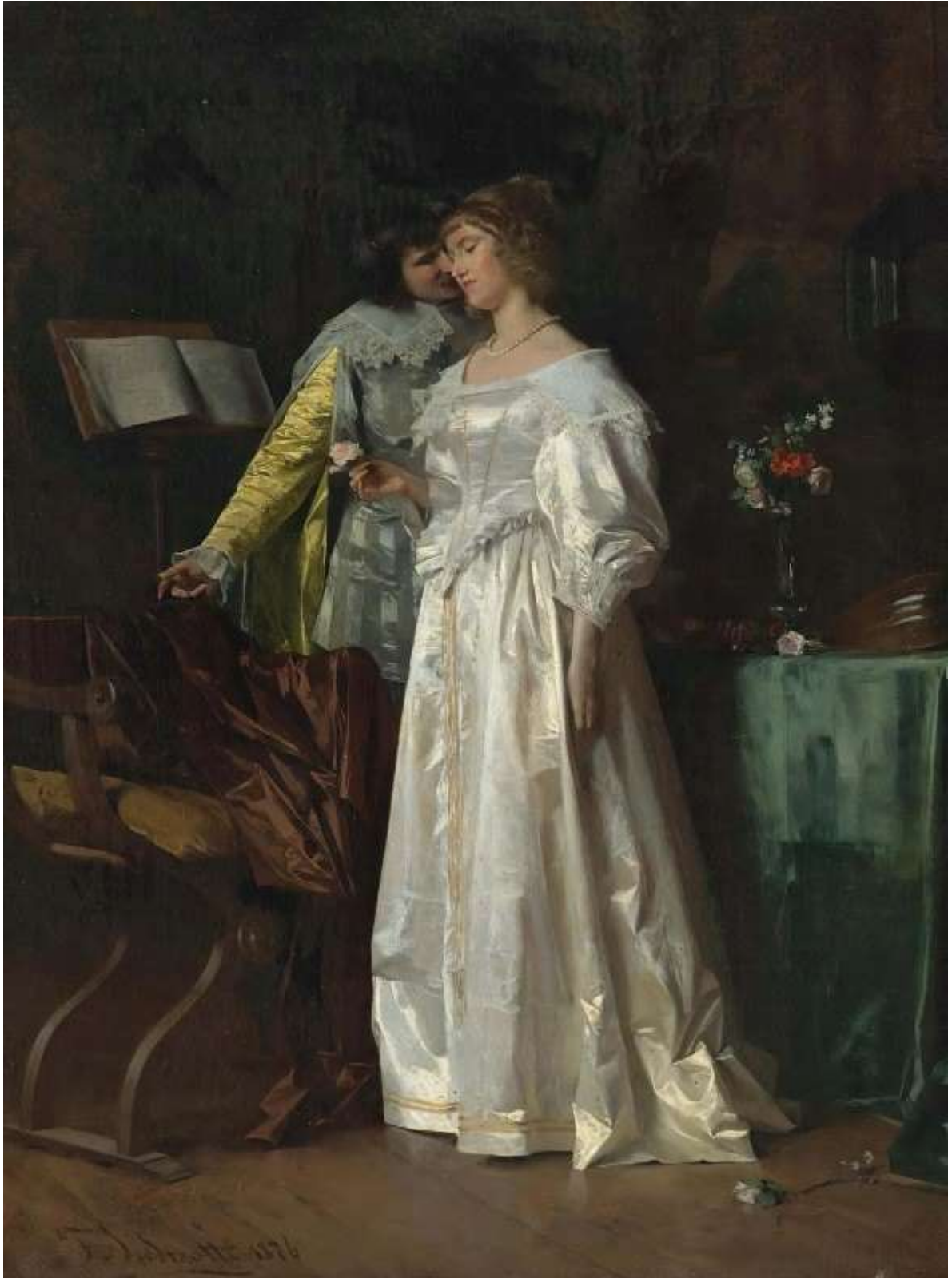
Lovers' Song (1876)