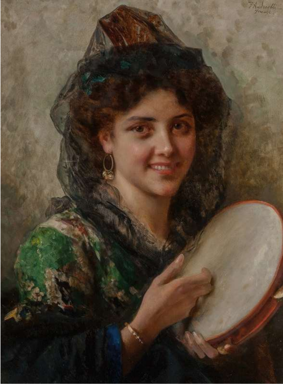
Girl with a tambourine