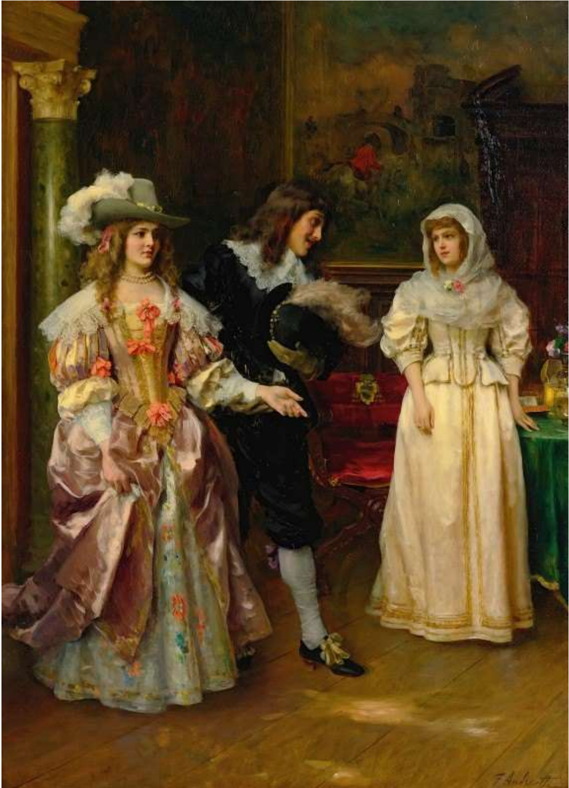
The Distinguished Visitor