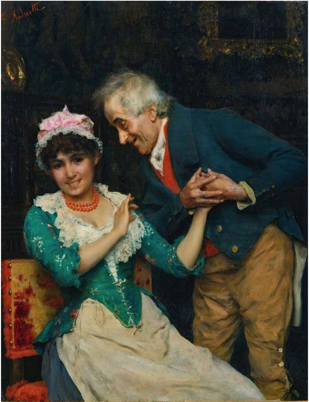
From The Heart