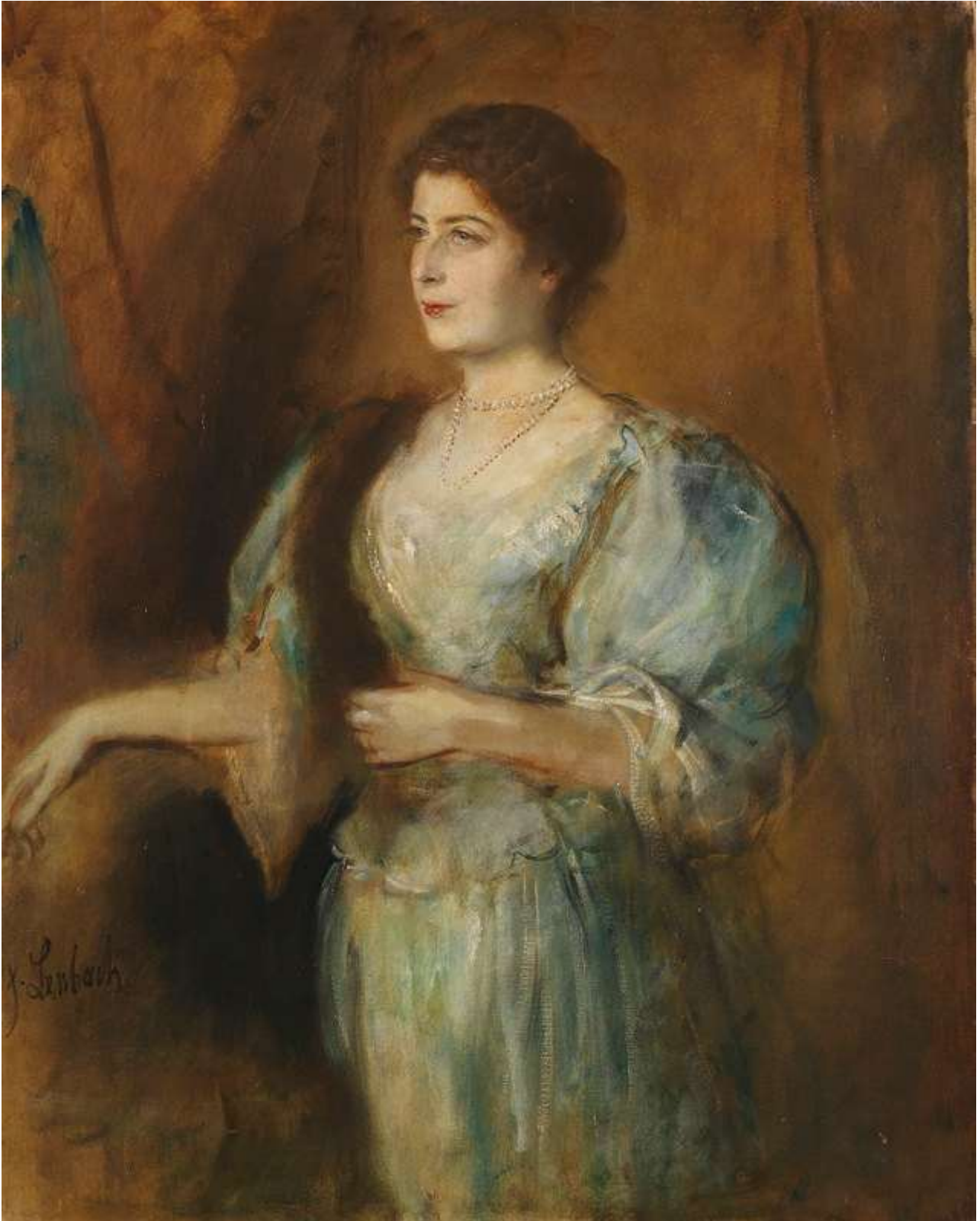
Porträt einer Dame mit Perlenkette und Pelzstola (1900)