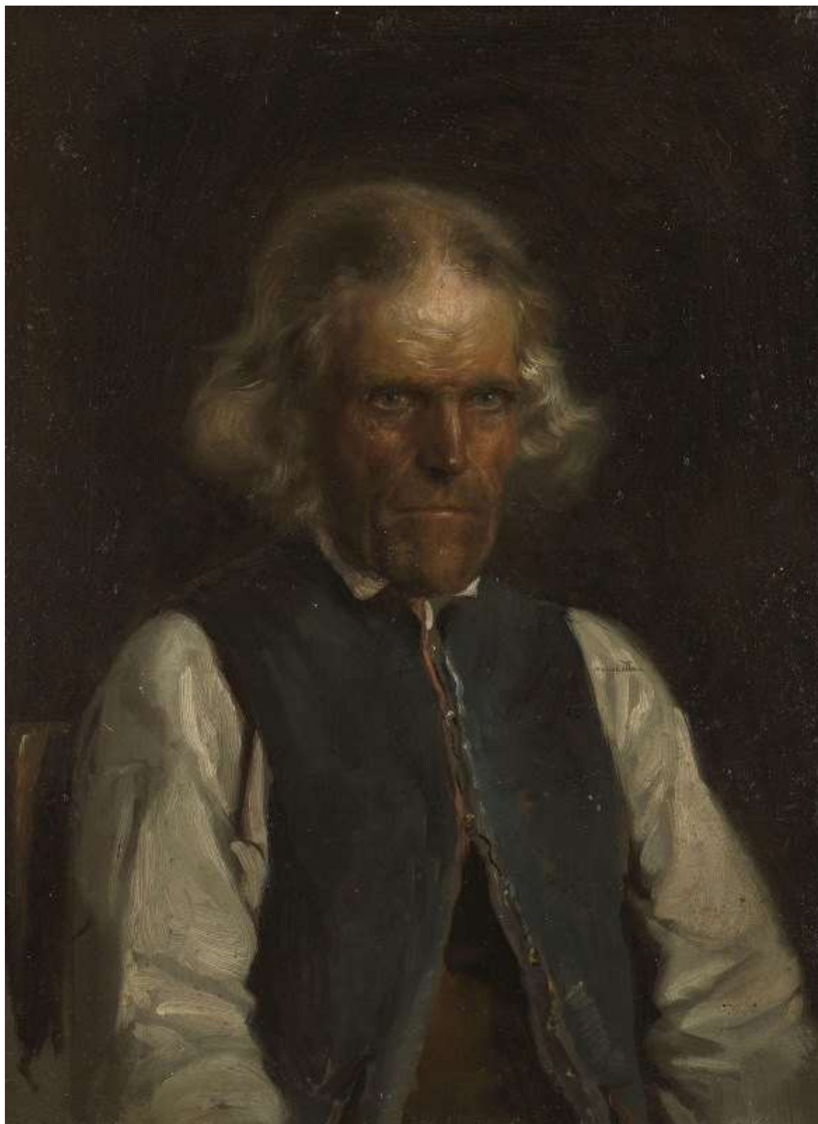
Portrait of a Farmer from Voss (1855)