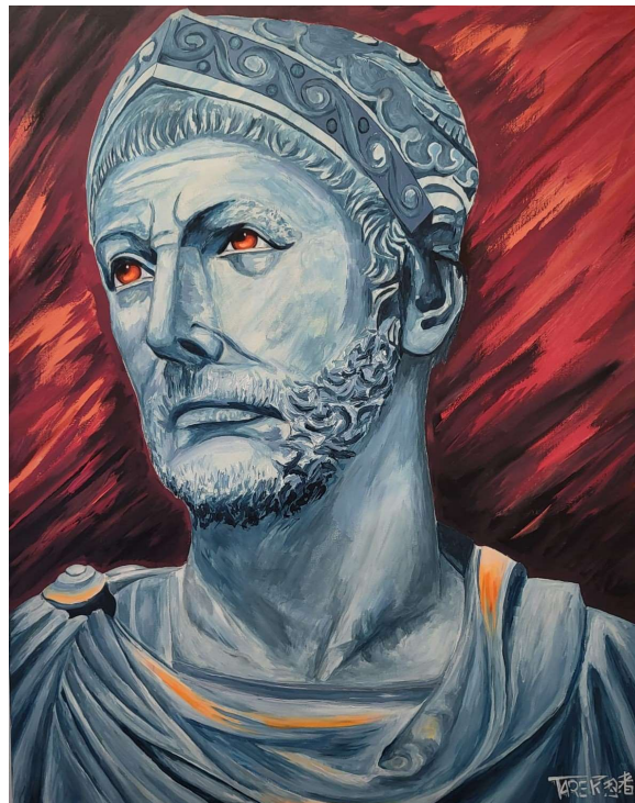
Hannibal Barca – Acrylique sur toile 100 x 80 cm

Avec un talent artistique prometteur et des retours positifs croissants, Artek est dès lors sur la voie d'un avenir prometteur sur la place de l'art plastique. Ce n'est que le début, et il est fort probable que nous entendrons beaucoup parler de ce jeune artiste tunisien à Paris. Artek incarne l'esprit de détermination et de résilience en transformant les obstacles en opportunités. Son parcours inspirant est une leçon pour tous ceux qui rêvent en grand, qui démontrent que la passion peut ouvrir les portes vers un avenir radieux lorsqu'elle est combinée à un travail acharné.