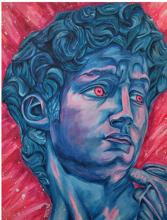
David – Acrylique sur toile 100 x 80 cm

Avec un talent artistique prometteur et des retours positifs croissants, Artek est dès lors sur la voie d'un avenir prometteur sur la place de l'art plastique. Ce n'est que le début, et il est fort probable que nous entendrons beaucoup parler de ce jeune artiste tunisien à Paris. Artek incarne l'esprit de détermination et de résilience en transformant les obstacles en opportunités. Son parcours inspirant est une leçon pour tous ceux qui rêvent en grand, qui démontrent que la passion peut ouvrir les portes vers un avenir radieux lorsqu'elle est combinée à un travail acharné.